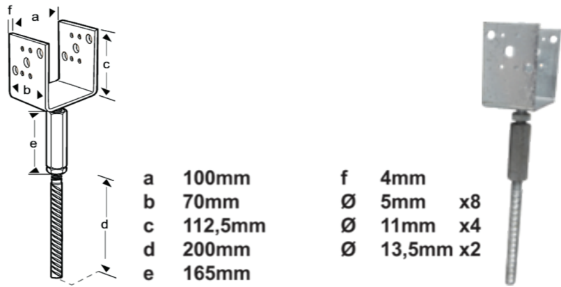
Bilde 2: Søylefundament med 4" justerbar sko